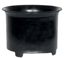
Serienmäßig: Zykloneinsatz Art.-Nr. 109.057