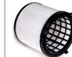
Serienmäßig: EPA12 Feinstaub-Filterpatrone Art.-Nr. 109.058