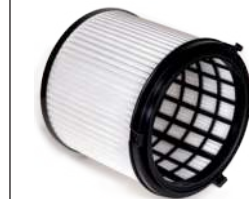
Serienmäßig: EPA12 Feinstaub-Filterpatrone Art.-Nr. 109.058