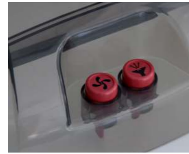
Sprüh- und Saugfunktion sind einzeln am Gerät zuschaltbar.