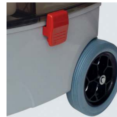
Große, gummierte Räder für spurloses Arbeiten auch auf empfindlichen Böden.