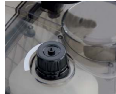
Ein separater Tank ermöglicht den Betrieb mit Entschäumer und garantiert damit ein kontinuierliches Arbeiten.