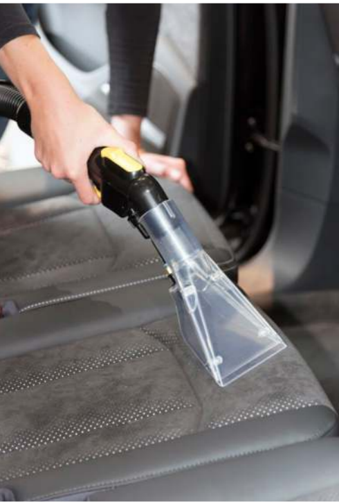
Glasklare Polster-Sprühdüse zur Reinigung von Polstermöbeln oder Fahrzeugsitzen. Ergonomischer Handgriff mit handlichen, bequemen Bedienelementen. Die Sprühfunktion ist per Bedienelement am Handgriff dosierbar.