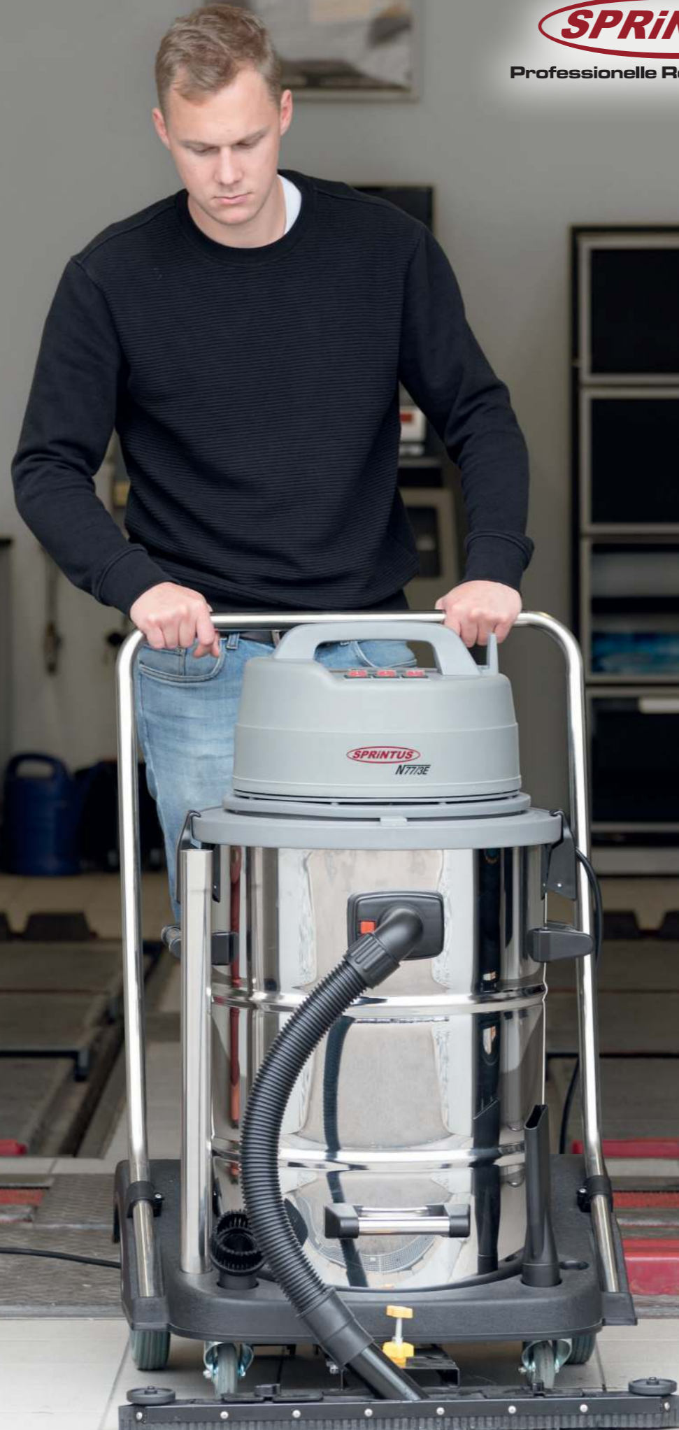
Abb. zeigt optionale Fahrbahndüse Art.-Nr. 103.010