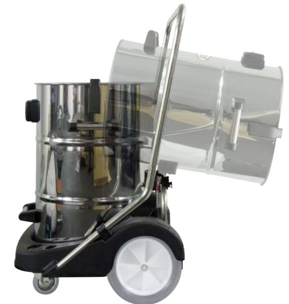
Grundausstattung: Kippfunktion ermöglicht ergonomisches Entleeren ohne Bücken oder Tragen.

Für den N 77/3 E ist optional eine 650 mm breite Fahrbahndüse für Nassanwendungen erhältlich, die fest am Fahrwerk montiert und von der Geräterückseite aus bedient wird.