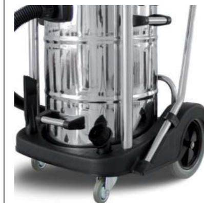
Stabiler Geräterahmen mit Zubehörsteckplätzen und Sauggeschirr-Parkposition.