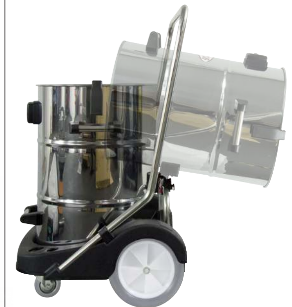
Grundausrüstung: Kippfunktion ermöglicht ergonomisches Entleeren ohne Bücken oder Tragen.

3 m Antistatikschauch. Art.-Nr. 102.116 Der Schlauch und Stutzen ist elektrisch leitend und sorgt für eine optimale Ableitung von möglicher elektrischer Aufladung über den geerdeten Behälter.